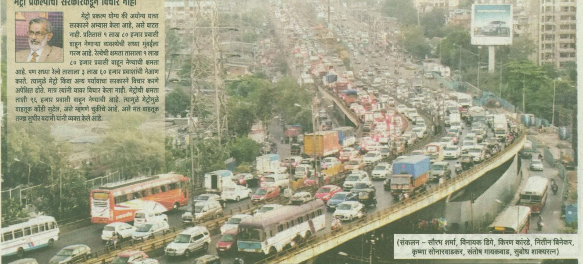
(संकलन - सौरभ शर्मा, विनायक डिगे, किरण कांरडे, नितीन बिनेकर, कृष्णा सोनारवाडकर, संतोष गायकवाड, सुबोध शाक्यरल)

वांद्रे कुर्ला संकुलात मेट्रो ३ आणि मेट्रो २ बी प्रकल्पांतर्गत दोन्ही मेट्रो प्रकल्पांचे इंटिग्रेशन असणार आहे. बीकेसीमध्ये मेट्रोचे सर्वात मोठे स्टेशन असणार आहे. या प्रकल्पाच्या निमित्ताने बीकेसीमध्ये सध्या कुर्ला आणि वांद्रे अशा दोन्ही दिशेने जाणाऱ्या वाहनचालकांना वाहतूक कोंडीचा फटका बसत आहे. भारतनगर ते कलानगर या पट्ट्यात दोन्ही दिशेने जाणाऱ्या वाहतूकीवर याचा परिणाम होतो. आयकर भवन ते कलानगरदरम्यान दोन्ही बाजूला मेट्रो २ बी प्रकल्पासाठी बॅरिकेड्स लावल्याने या मार्गावरील एक लेन वाहतूकीसाठी कमी झाली आहे. त्यामुळे आयकर भवनजवळ मोठ्या प्रमाणात वाहतूक कोंडी होते.